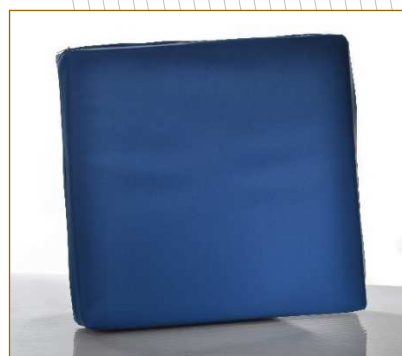
Ref. 96201 Medidas: 43x43x7 cm