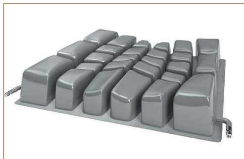
Ref. 95612 Medidas: 42x40x7,5 cm