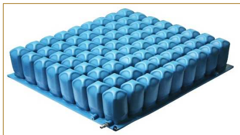
Ref. 95610 Medidas: 40x40x10 cm Ref. 95611 Medidas: 46x46x10 cm