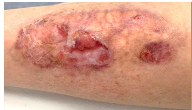
Imagen 6. Aspecto de la lesión tras cuatro meses y medio. Progresiva hipergranulación (Fuente: Imagen propia).