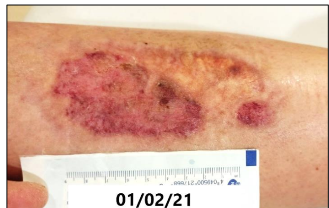
Imagen 7. Aspecto de la lesión tras cinco meses de evolución. Alta con indicación compresión terapéutica (Fuente: Imagen propia).