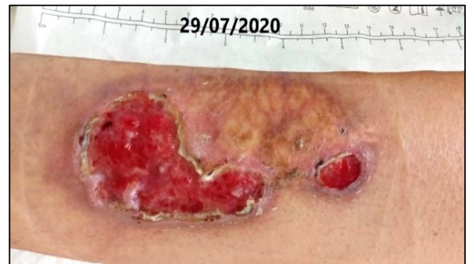
Imagen 2. Aspecto de la lesión tras 6 días de evolución.