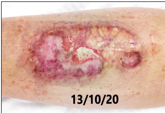
Imagen 4. Aspecto de la lesión tras un mes aplicando compresión terapéutica (Fuente: Imagen propia).

El 09-11-2020: persiste zona esfacelada pese a desbridamientos (Imagen 5). Se detiene el tratamiento con betametasona tópica, iniciándose tratamiento con modulador de proteasas (Urgo-Start Plus®). En semanas siguientes se objetiva una disminución de la necrosis, siendo innecesario mantener desbridamientos cortantes. Se constata progresión de la epitelización.