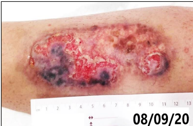
Imagen 3. Aspecto de la lesión tras mes y medio de evolución, previo a la compresión terapéutica.

El día 08-09-2020: inicio de compresión con medias elásticas de grado médico CCL2. Para facilitar su colocación se indica apósito de espuma con borde de silicona como apósito secundario (Allevyn® Gentle Border 12,5x12,5cm). La lesión mantiene una disminución de diámetro y ausencia de signos de infección durante las semanas siguientes (Imágenes 3 y 4).