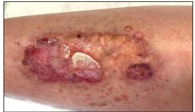
Imagen 5. Aspecto de la lesión tras tres meses y medio. Persiste zona esfacelada pese a desbridamientos (Fuente: Imagen propia).

El 10-12-2020: progresiva hipergranulación (Imagen 6). Se suspenden moduladores de proteasas reiniciándose betametasona tópica, manteniendo apósito de espuma con borde de silicona como apósito secundario hasta el 21-12-2020. A partir de entonces se trata la lesión sólo con dicho apósito, manteniéndose este tratamiento hasta epitelización completa (01-02-2021) (Imagen 7). Alta con indicación compresión terapéutica crónica de extremidades inferiores a través de medias.