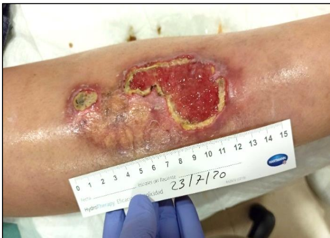
Imagen 1. Aspecto inicial de la lesión.

Necrobiosis lipídica diabetorum ulcerada en extremidad inferior derecha. Insuficiencia venosa periférica (Imagen 1).